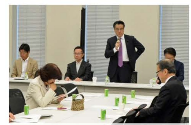
共生社会創造本部長は岡田代表

安倍政権の下で再び拡大しつつある格差の固定化を止め、「共生社会」実現のための制度設計を進めていきます。