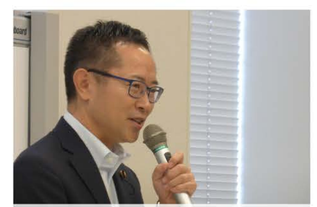
税調会長として共生社会を推進