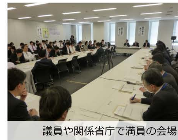
議員や関係省庁で満員の会場