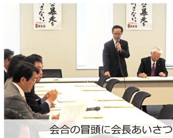
会合の冒頭に会長あいさつ