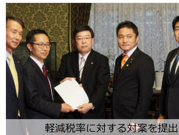
軽減税率に対する対案を提出