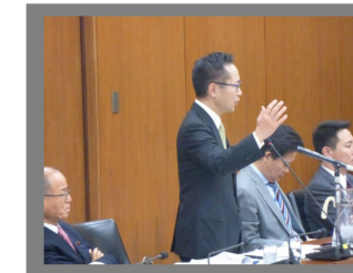
2月12日 財務金融委員会 〈主な答弁者〉 黒田日銀総裁、麻生財務大臣

マイナス金利導入直後の黒田日銀総裁に「戦力の逐次投入」はしないと主張しているにもかかわらず客観的に見れば「逐次投入」となっている現状に至った見通しの甘さについて追及をしました。