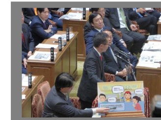
2月15日 予算委員会 〈主な答弁者〉 安倍総理、麻生財務大臣

軽減税率について、「消費者」「事業者」「働く人」の観点から問題が起こりうるケースを具体的に例示。財務省の答弁が終始曖昧だった上、麻生財務大臣も混乱や廃業が起こりうることを認めました。