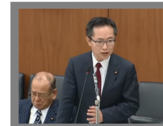
2月24日 財務金融委員会 〈主な答弁者〉 黒田日銀総裁、麻生財務大臣

軽減税率に対応する体制が国税庁と税務署で整っているかを質問。全国に12の国税局と524の税務署がある中で、対応のための増員が132人しかいないことを質しましたが明確な答弁はありませんでした。