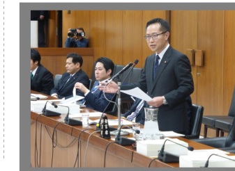
3月1日 財務金融委員会 〈主な答弁者〉 安倍総理、麻生財務大臣

軽減税率は来年4月から実施予定であるにもかかわらず、財務省が昨年12月に出した資料に法案成立から「準備に最低1年半が必要」と記載されていることを追及。準備が整っていない実態が明らかになりました。