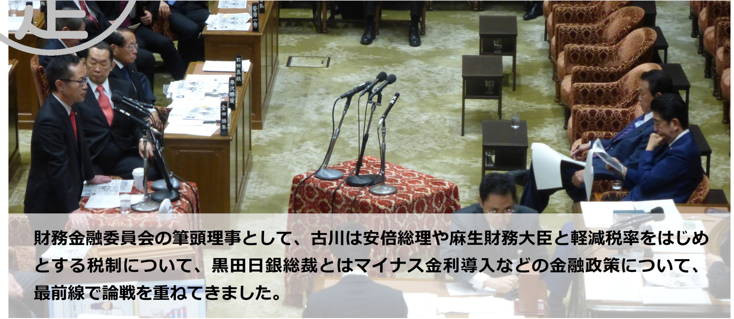
財務金融委員会の筆頭理事として、古川は安倍総理や麻生財務大臣と軽減税率をはじめとする税制について、黒田日銀総裁とはマイナス金利導入などの金融政策について、最前線で論戦を重ねてきました。